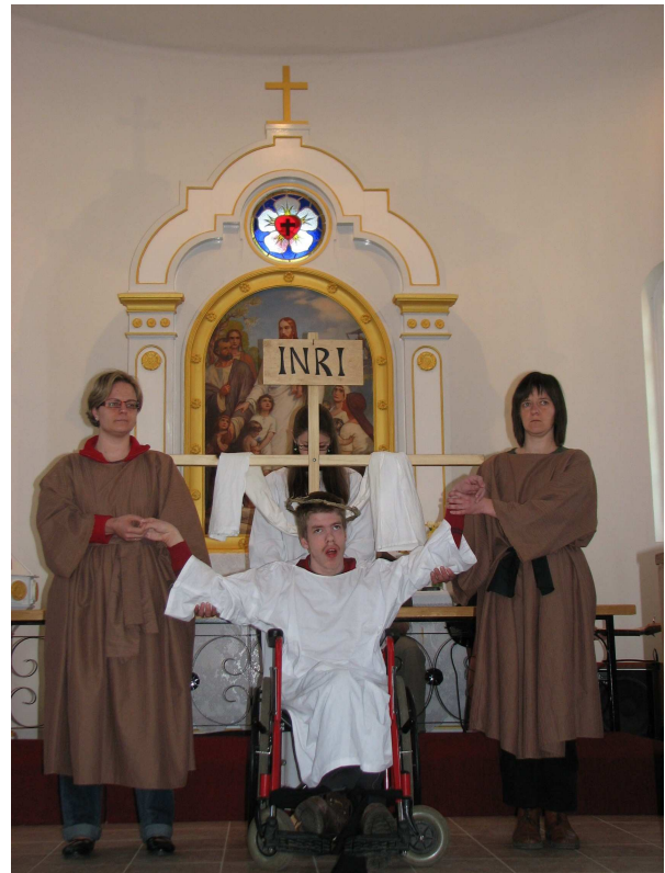
Jelenet a 2009. év Mozgássérült Passióból

Krisztus értünk halt meg a keresztfán Mindannyiunk bűnéért szenvedett Ott ülven most Atyjának a jobbján Onnan oszt áldást és szeretetet.